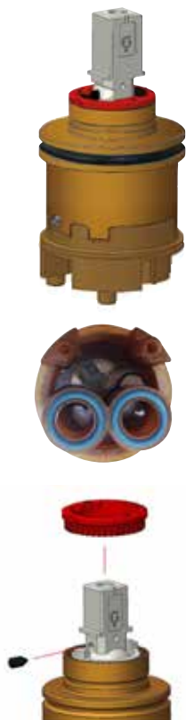
limitatore di portata e temperatura LPT adjustable flow rate and temperature limiter LPT