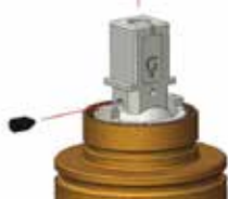
limitatore di portata e temperatura LPT adjustable flow rate and temperature limiter LPT