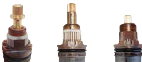
0432AFONF-009 0432AFONF-004 0432AFONF-015